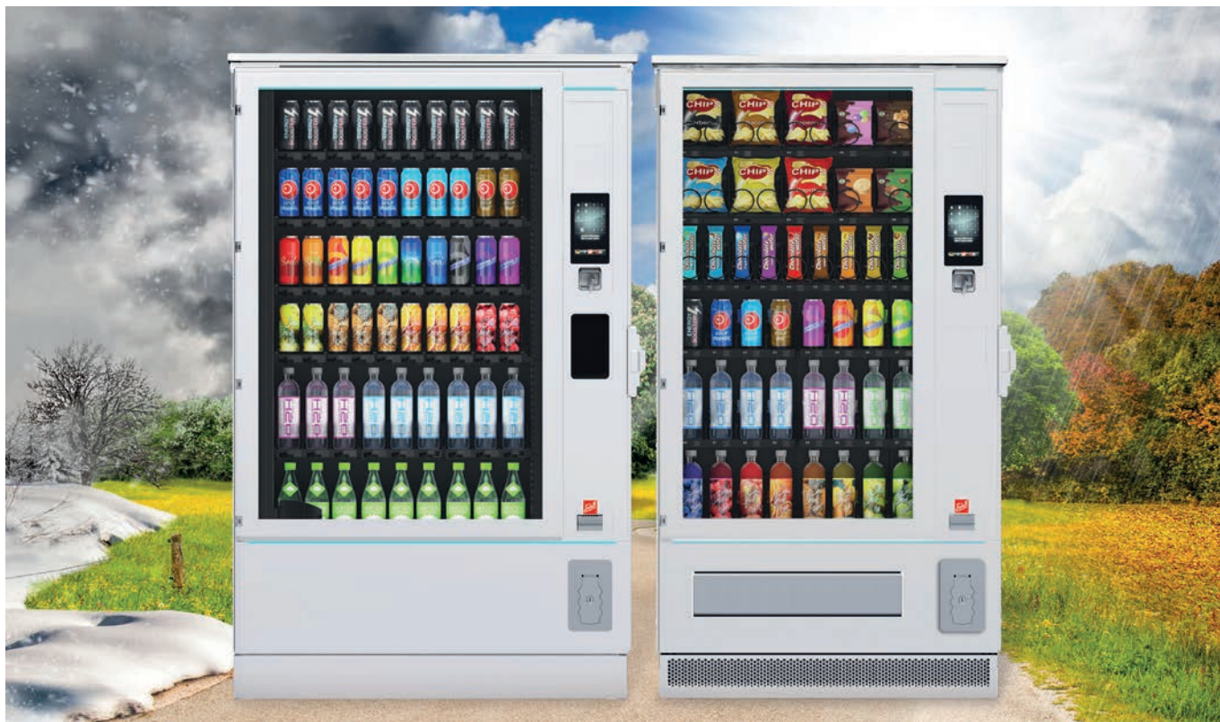
SiLine® GF L RO en couleur standard RAL 9010

SiLine® Outdoor : une prise électrique et le tour est joué, les distributeurs sont prêts à vendre par tous les temps.