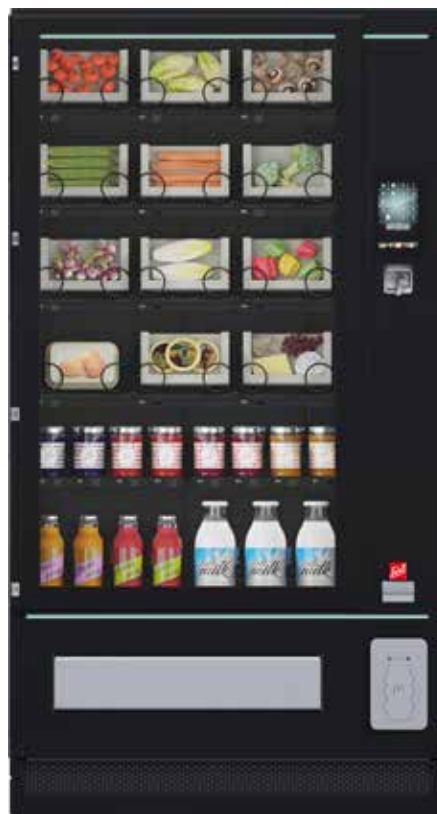
SiLine Combi M RP RA mit Designpaket A