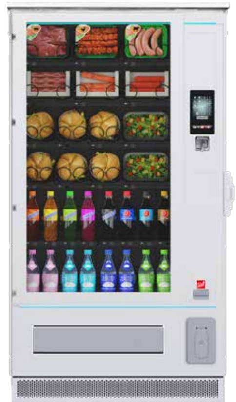
SiLine Combi M RO

* Abweichungen der Gehäuseabmessungen sind aufgrund von Anbauteilen und Zubehör möglich. Energieeffizienz aller Typen unter www.sielaff.de/produkte/energieverbrauchskennzeichnung